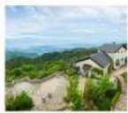
สโก: การ์เด็น เทอร์เรซ