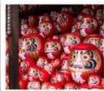
วัดคัตสึโฮจิ