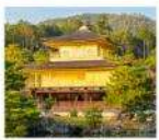
คิงคะคุจิ