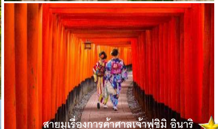
สายมูเรื่องการค้าศาลเจ้าฟูชิมิ อินาริ