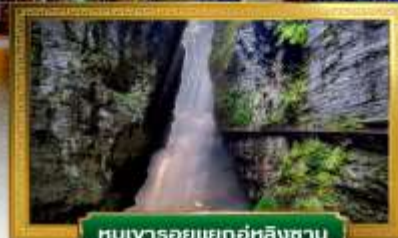
หุบเขารอยแยกอุหลิงซาน

เดินทางโดย: สายการบินโซน่าอี็กซ์เพรสแอร์ไลน์