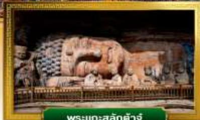
พระแกะสลักต้าจู้