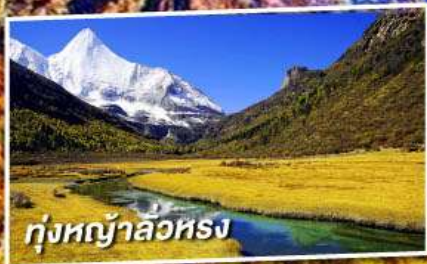
ทุ่งหญ้าลวหรง