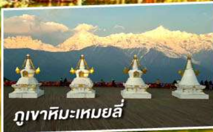
ภูเขาหิมะเหมยลี่