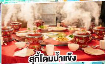
สุกี้ไคมน้ำแข็ง