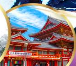
วัดโอสึ คันนง