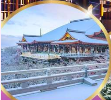
วัด คิโยมิจิ