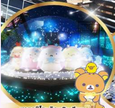
ซากามิโกะ อิลลูมิเนชัน ธันเดอร์จุดสุดท้ายจากสาย SAN-X