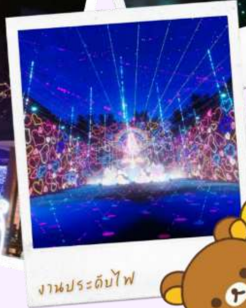
งานประดับไฟ