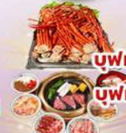
บุฟเฟต์ ชาบู 1 มื้อ