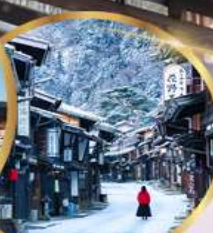
หมู่บ้านโบราณ นาระอิ จุกุ