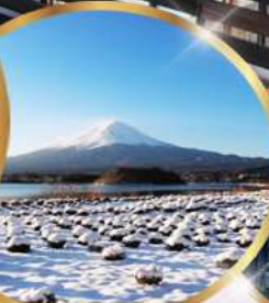
สวน โออิชิ พาร์ค