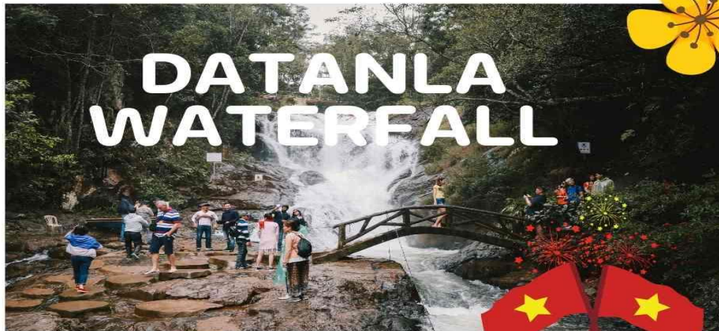
DATANLA WATERFALL น้ำตกดาตันลา

นำท่านเดินทางสู่ เมืองดาลัก เมืองในหมอก เป็นเมืองที่แสนโรแมนติก ซึ่งได้ชื่อว่าเป็น หุบเขาแห่งความรัก สัมผัสบรรยากาศที่แสนโรแมนติก โอบล้อมไปด้วยขุนเขา แมกไม้บานาพันธ์ และทะเลสาบ ดาลักได้ชื่อว่าเป็นแหล่งท่องเที่ยวที่โรแมนติกที่สุดในเวียดนาม มีอุณหภูมิตลอดทั้งปี 15-25 องศา