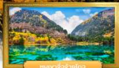
หุบเขาจิวจ้ายโกว