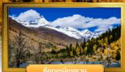
ซื้อตั๋วเหิมยงซาน