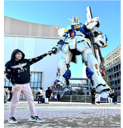
หุ่นกันดั้ม ชื่อ RX93 FF Nu Gundam

เดินทางต่อไปยัง ร้านค้า DUTY FREE ให้ท่านได้ซื้อปิ้งสินค้าปลอดภาษีที่มีคุณภาพ อาทิ เครื่องสำอาง โฟมล้างหน้า(แนะนำ) อาหารเสริม ขนม เครื่องใช้ต่างๆ ฯลฯ ...จากนั้นแวะ แชะรูปกับหุ่นกันดั้มยักษ์ ณ ห้าง LaLaport (หากมีเวลาพอ) มีขนาดใหญ่กว่า Unicorn Gundam ที่โตเกียวและใหญ่กว่า RX93 FF Gundam ที่ Gundam Factory Yokohama เรียกได้ว่าเป็นแลนด์มาร์คสำคัญของเมืองฟูกุโอกะในปัจจุบัน ...จากนั้นอิสระให้ท่านซื้อปิ้งย่าน เทนจิน (Tenjin) หรือ ย่านฮากาตะ (Hakata) เป็นย่านช้อปปิ้งขนาดใหญ่ใจกลางเมือง รวบรวมแหล่งบันเทิง อย่างครบครัน ไม่ว่าจะเป็นตึกต้นไม้ ร้านค้าที่น่าสนใจ และบรรยากาศสุดคลาสสิก หรือจะเป็นย่านของกินอร่อยๆ อย่างย่านยะไต (Yatai) หมายถึง ชุมชขายอาหารที่มีขนาดเล็กไม่ใหญ่มาก ที่รวมร้านอาหารแบบฉบับท้องถิ่นเอาไว้มากมาย