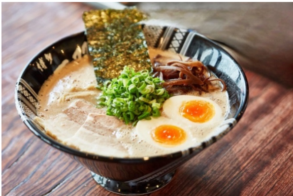
ฮากาตะราเมง (Hakata Ramen)