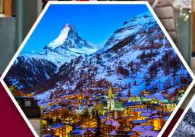
เซอร์แมต