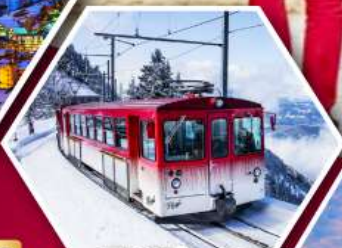
รถไฟใต้เขารัก