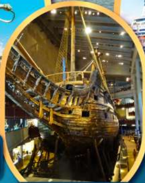
พิพิธภัณฑ์เรือวาซา