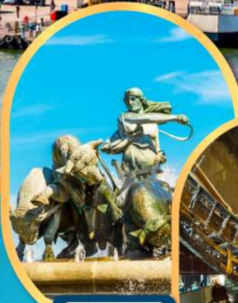
น้ำพุแห่งราชินีเทฟลอน