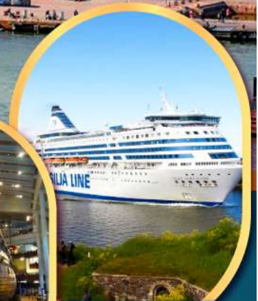
เรือสำราญ TALLINK SILJA LINE