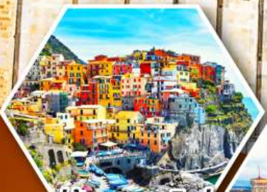
หมู่บ้านมานาโรล่า