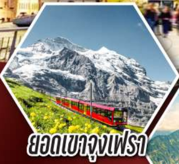
ยอดเขาจุงเฟรา