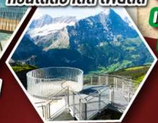
ยอดเขา กรินเดลวาลด์ เพียสตี