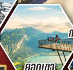
ยอดเขา ฮาร์เตอร์คูลุม