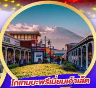
โทกเมบะ-พรีเมียมเอ้าเล็ท