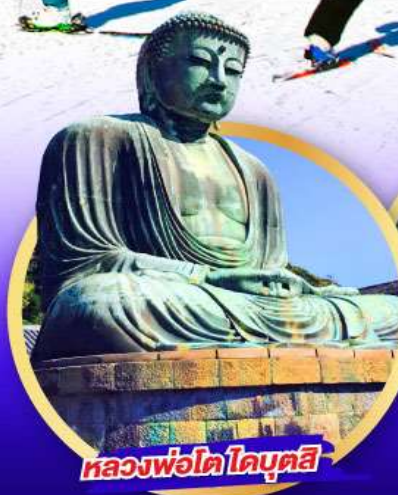
หลวงพ่อโต โดบุตสึ