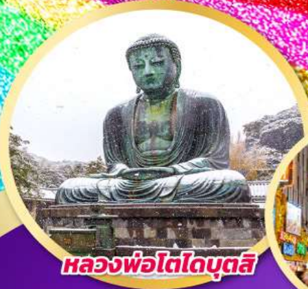
หลวงพ่อโตโตบุตสึ