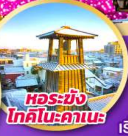
หอรบั้ง โทคิโนะคานะ