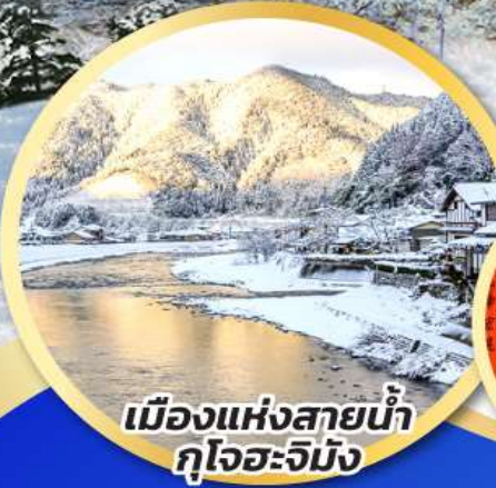
เมืองแห่งสายน้ำ กุโจะจิมัง