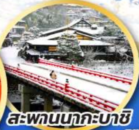
สะพานนาคะบาชิ

ชมเมืองแห่งสายน้ำ บรรยากาศย้อนยุค "กุโจะจิมัง"