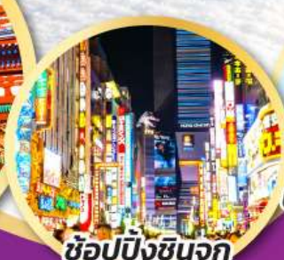
ช้อปปิ้งชินจูกุ