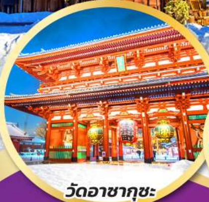
วัดอาซากุสะ