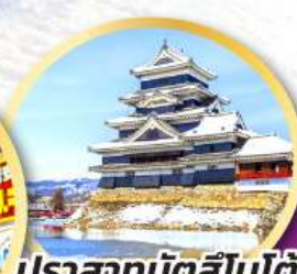
ปราสาทมัตสึโมโตะ

หมู่บ้านมรดกโลกชิราคาวาโกะ สนุกกับกิจกรรมลานสกี