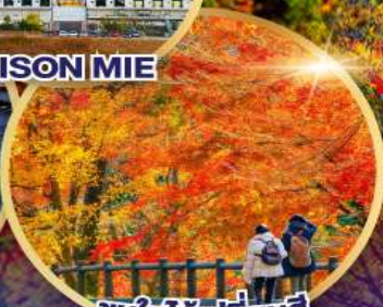
ชมใบไม้เปลี่ยนสี หุบเขามิซุซาวะโมมิจิดานิ