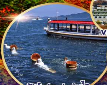
ชมโชว์อาป่าคาน้ำ วนเกาะไปบุกซึกิโมโตะ