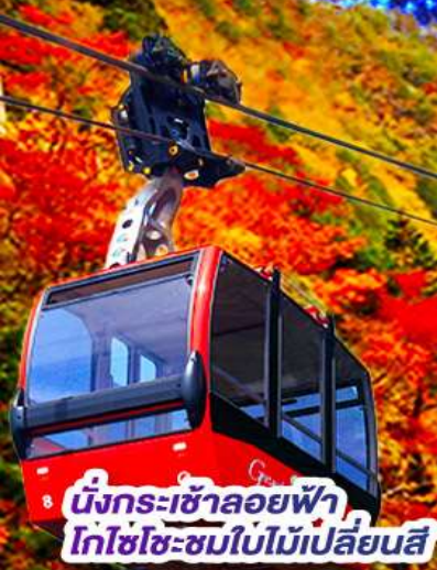
นั่งกระเช้าลอยฟ้า โกโซโซะชมใบไม้เปลี่ยนสี