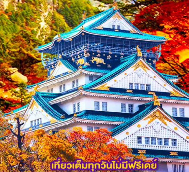
เที่ยวเต็มทุกวันไม่มีฟรีเคย์