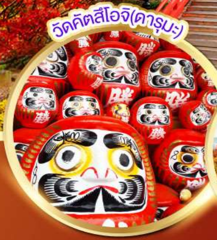
วัดคิตสึโอจิ(ดาร์มะ)