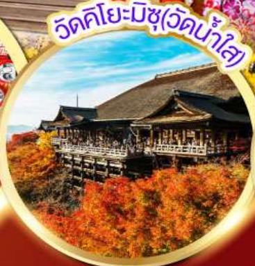
วัดคิโยะมิซึ(วัดน้ำใส)