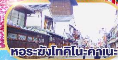
หอรังโทคิโนะคานะ