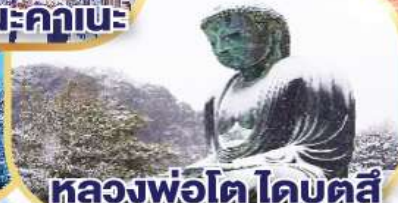
หลวงพ่อดาโดบุตสึ