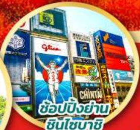
ช้อปปิ้งย่านชินไซบาชิ