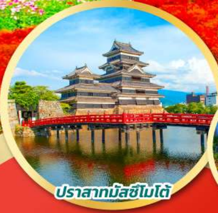
ปราสาทมัตสึชิมะ