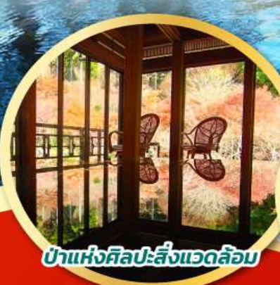
ป่าแห่งศิลปะสิ่งแวดล้อม