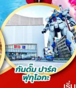
กันดั้ม ปาร์ค ฟุกุโอกะ