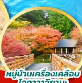
หมู่บ้านเครื่องเคลือบโอคาวาจิยามะ