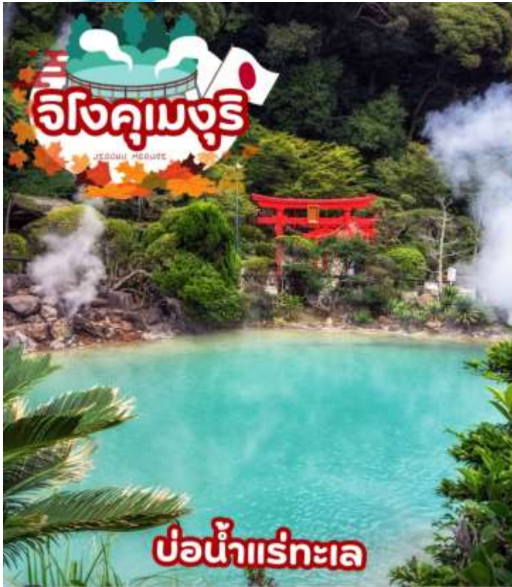
บ่อน้ำแร่ทะเล