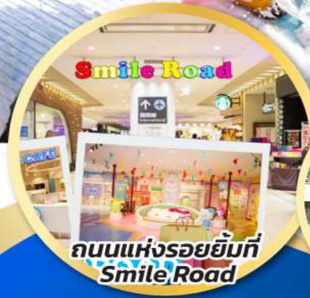
ถนนแห่งรอยยิ้มที่ Smile Road