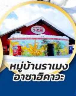
หมู่บ้านราเมง อาซาฮิคาวะ

ชมความน่ารักของน้องๆ ที่สวนสัตว์อาซาฮิคาวะ