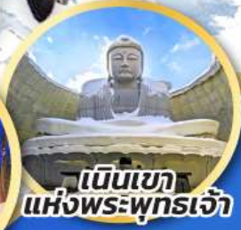
เป็นเขา แห่งพระพุทธรเจ้า

ชมความน่ารักของสัตว์ต่างๆ ที่พิพิธภัณฑ์สัตว์น้ำโอตารุ