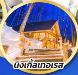
นิงเกิ้ลเทอเรส