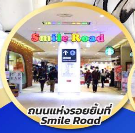
ถนนแห่งรอยยิ้มที่ Smile Road