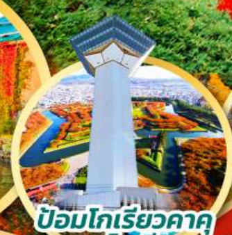
ป้อมโทริเยวคาคู หอคอยโทริเยวคาคู