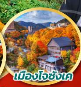
เมืองโจซังเค

พักโจซังเค 1 คืน พักออนเซ็น 3 คืน พักโรงแรมในชิปปะโร 1 คืน