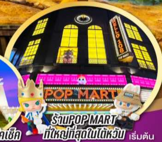
ร้าน POP MART ที่ใหญ่ที่สุดในไต้หวัน เริ่มต้น

เมนูพิเศษ!! ซามู บุฟเฟ่ต์ ปลาประธนาธิบดี, เสี่ยวหลงเปา