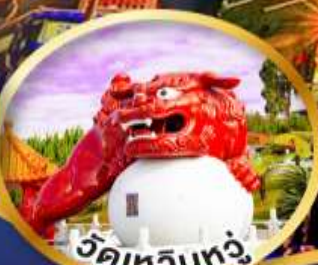
วัดเหวินหัว

ชมพลุดอกไม้ไฟเทศกาลปีใหม่ 30 ธ.ค. 67-03 ม.ค. 68