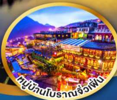
หมู่บ้านโบราณจิวเฟิน