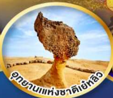
อุทยานแห่งชาติเย่หลิว