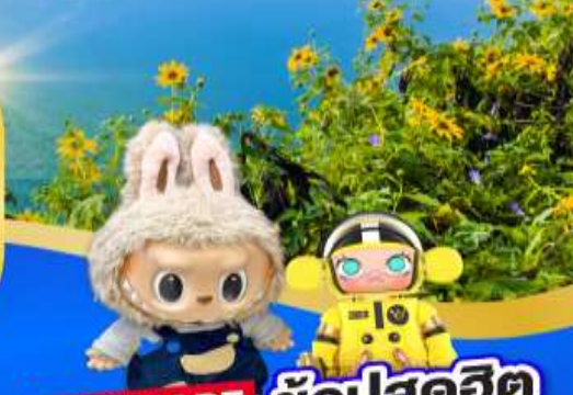
POP MART ซ้อปสุดฮิต