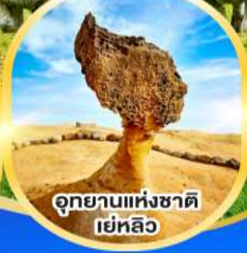
อุทยานแห่งชาติ เย่หลิว