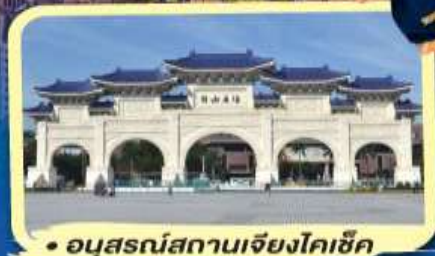
• อุทยานสกลาณเจียงไคซี