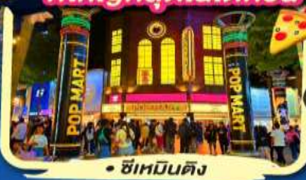
• ซิเหมินดิง