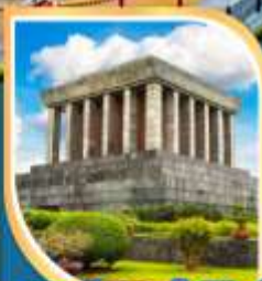
สุสานประธานโฮจิมินห์