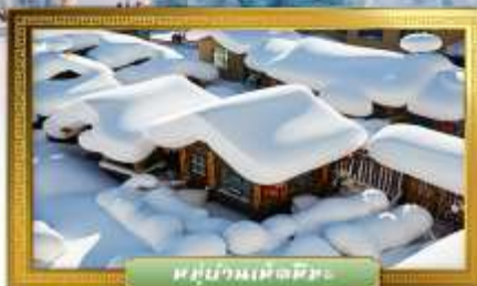
หมู่บ้านเห็ดหิมะ