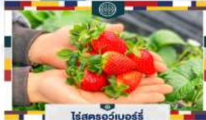
ไร่สตรอว์เบอร์รี่