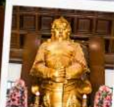
วัดเขangkมิม