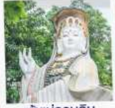
เจ้าแม่กวนอิม ธิพลาลัย