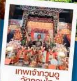
เทพเจ้ากวนอู วัดกวนไท