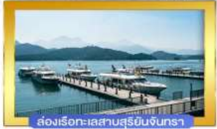
ส่องเรือทะเลสาบสุริยจันทร์