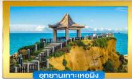
อุทยานเกาะเหอผิง