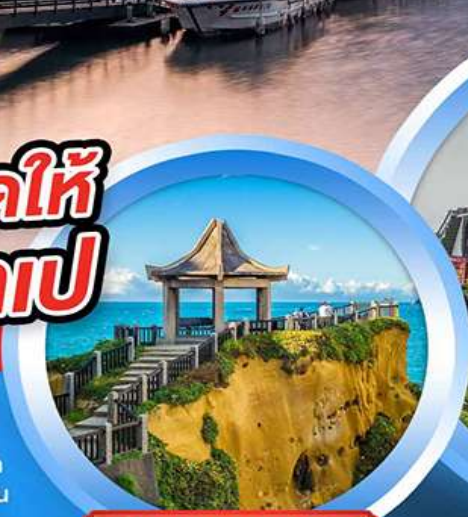
อุทยานเกาะเหอผิง