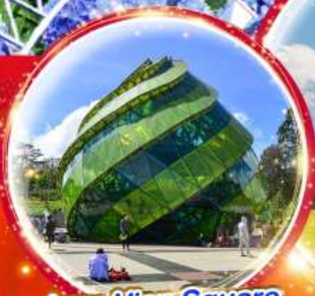
Lam Vien Square