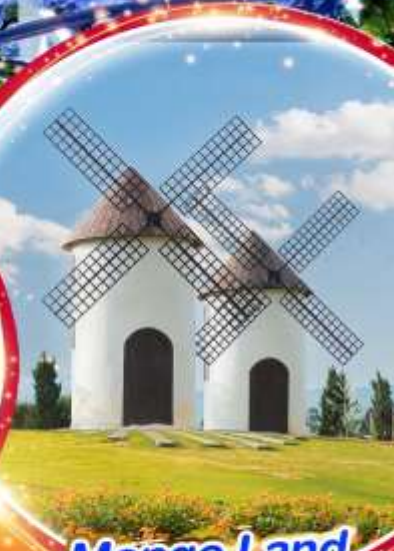
Mongo Land Dalat