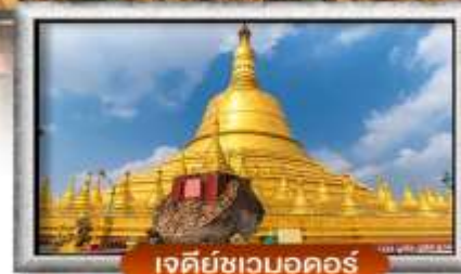
เจดีย์ชเวดากอง

เมนู สุดพิเศษ | กุ้งแม่น้ำเผาทำนละ 1 ตัว