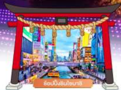
ช้อปปิ้งชินไซบาชิ

เดินทางโดยสายการบิน : ไทยแอร์เอเชียเอ็กซ์