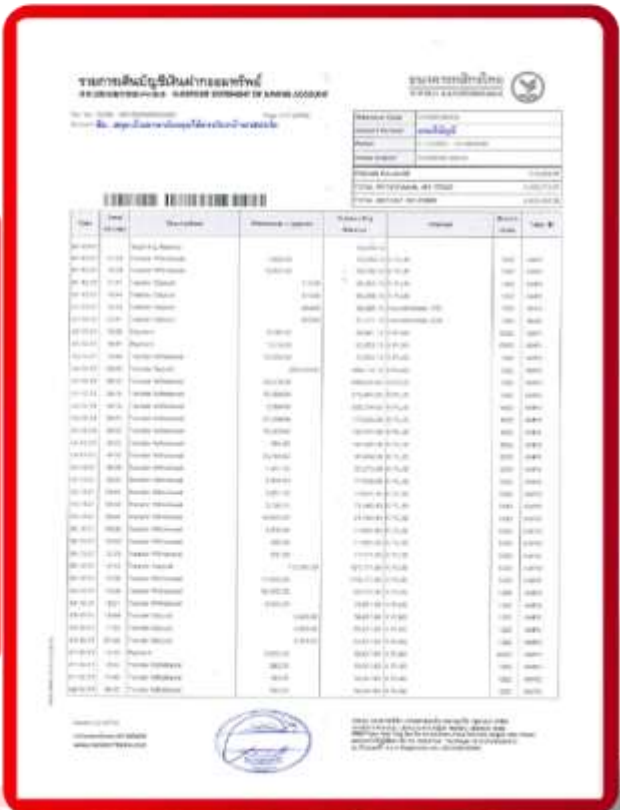
ตัวอย่าง Bank Statement ที่ผู้สมัครต้องขอจากธนาคาร

3.4 ปรับสมุดบัญชีธนาคารตัวจริง และเตรียมไปในวันที่ยื่นวีซ่า