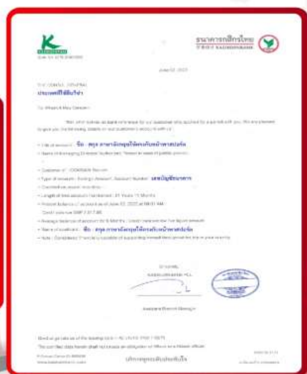
ตัวอย่าง Bank Guarantee ที่ผู้สมัครต้องข้อมา