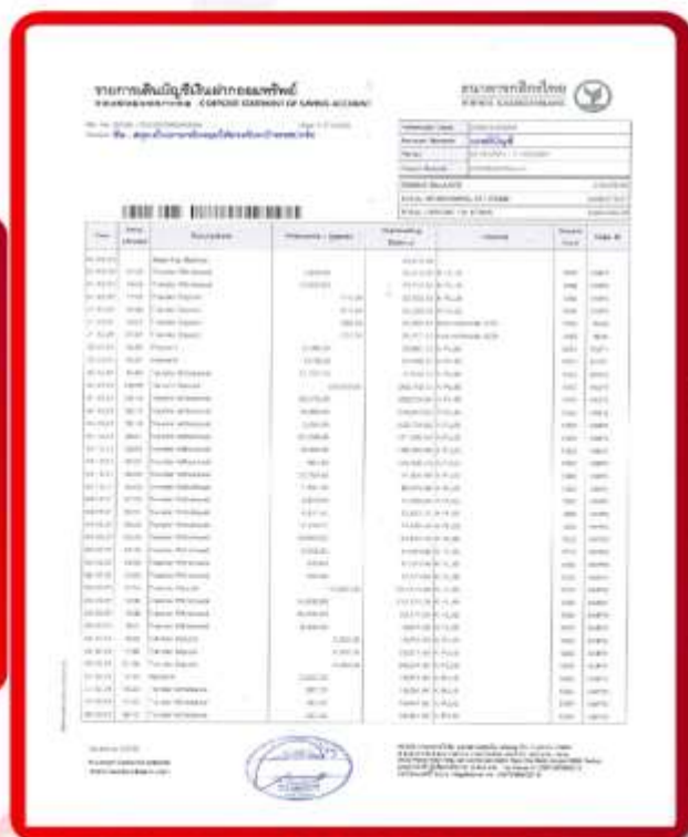
ตัวอย่าง Bank Statement ที่ผู้สมัครต้องข้อมา

3.3 ปรับสมุดบัญชีธนาคารตัวจริง และเตรียมไปในวันที่ยื่นวีซ่า