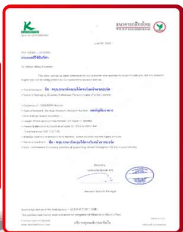
ตัวอย่าง Bank Guarantee ที่ผู้สมัครต้องขอจากธนาคาร