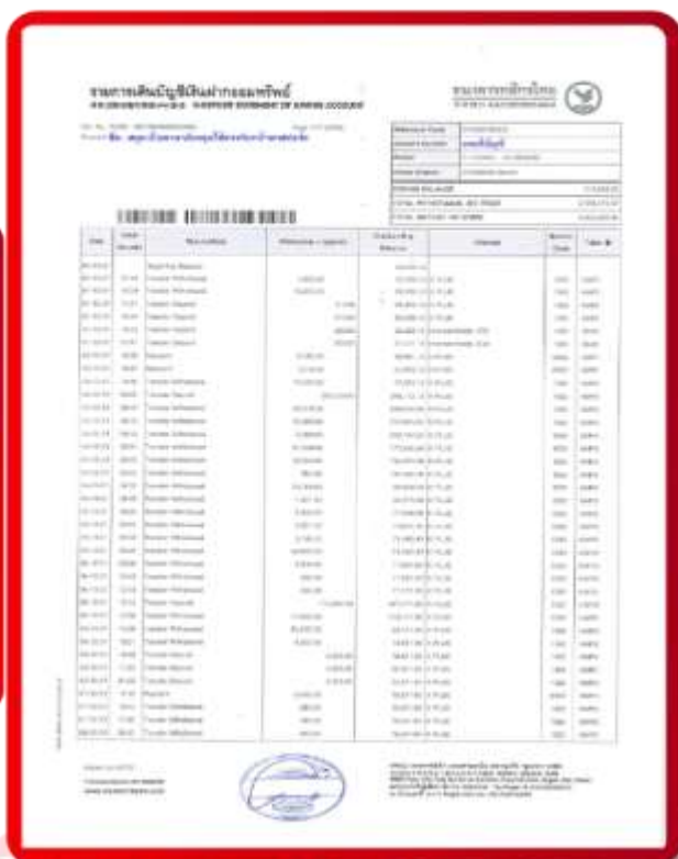
ตัวอย่าง Bank Statement ที่ผู้สมัครต้องขอจากธนาคาร

3.4 ปรับสมุดบัญชีธนาคารตัวจริง และเตรียมไปในวันที่ยื่นวีซ่า