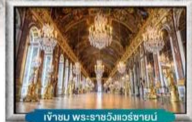
เข้าชม พระราชวังแวร์ซายน์