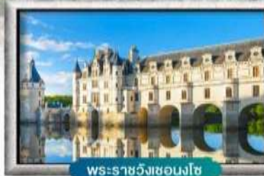
พระราชวังชองงโซ