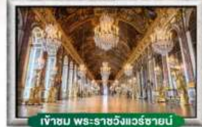
เข้าชม พระราชวังแวร์ซายน์

📍 พักดีกลางเมือง ใกล้ Metro เดินทางสะดวก