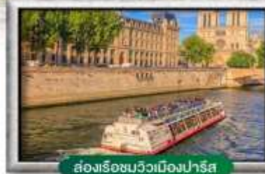
ส่องเรือชมวิวเมืองปารีส