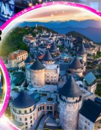
Ba Na Hills