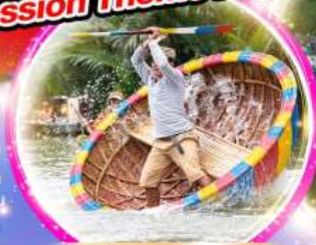
นั่งเรือกระด้ง