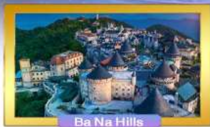
Ba Na Hills