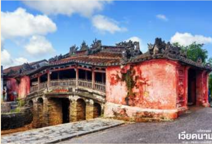
เวียดนาม