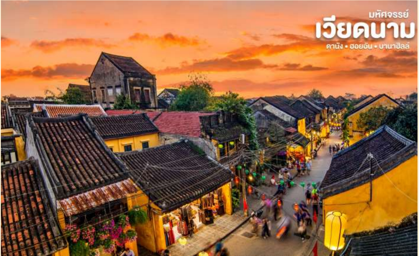
มัทศจรรย์ เวียดนาม คาบิง • ฮอยอัน • บานาฮิลล์