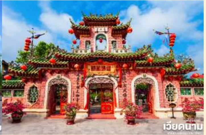
เวียดนาม