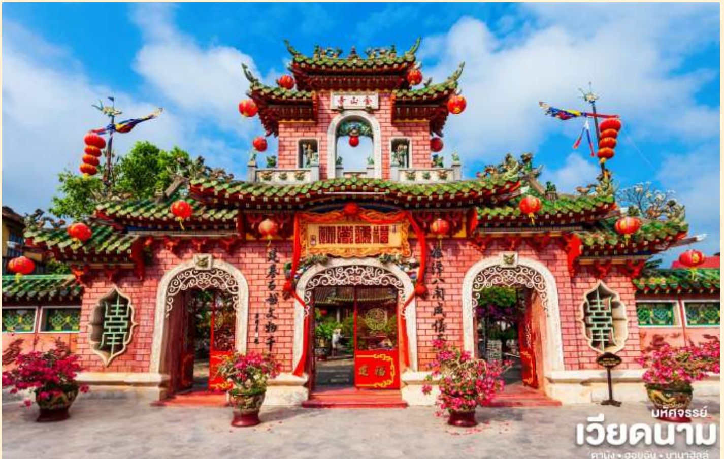
บห์จวรัย

นำท่านชม วัดจิน เป็นสมาคมชาวจีนที่ใหญ่และเก่าแก่ที่สุดของเมืองฮอยอันใช้เป็นที่พบปะของคนหลายรุ่น วัดนี้มีจุดเด่นอยู่ที่งานไม้แกะสลักลวดลายสวยงามท่าน สามารถทำบุญต่ออายุโดยพิธีสมัยโบราณ คือ การนำรูปที่ขีดเป็นก้นหอย มาจุดทิ้งไว้เพื่อ เป็นสิริมงคลแก่ท่าน