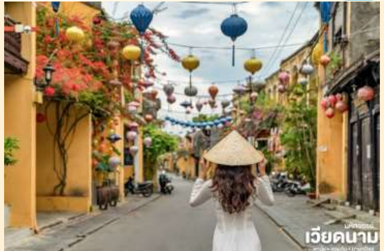
เวียดนาม

เมืองฮอยอันนั้นอดีตเคยเป็นเมืองท่า การค้าที่สำคัญแห่งหนึ่งในเอเชียตะวันออกเฉียงใต้และเป็นศูนย์กลางของการ แลกเปลี่ยนวัฒนธรรมระหว่างตะวันตกกับตะวันออกองค์การยูเนสโกได้ประกาศให้ฮอยอันเป็นเมืองมรดกโลกทางวัฒนธรรมเนื่องจากเป็นสถานที่สำคัญทางประวัติศาสตร์ แม้ว่าจะผ่านการบูรณะขึ้นเรื่อยๆ แต่ก็ยังคงรูปแบบของเมืองฮอยอันไว้ได้