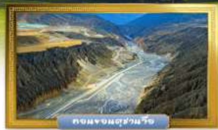
ถนนขงมู่ฮานาอี

เดินทางโดยสารการบินอุรุมชีแอร์ อาหาร : 19 มื้อ โรงแรม : 4 ดาว