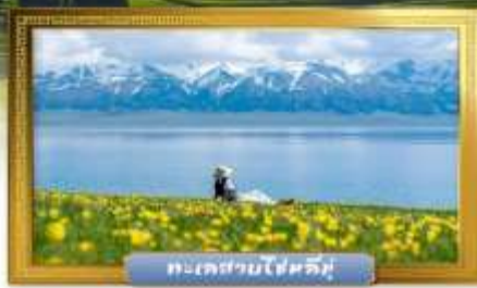
ทะเลสาบโซหลี่มู่