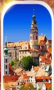
CESKY KRUMLOV CZECH