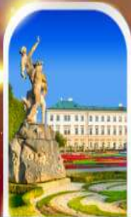
MIRABELL PALACE AUSTRIA