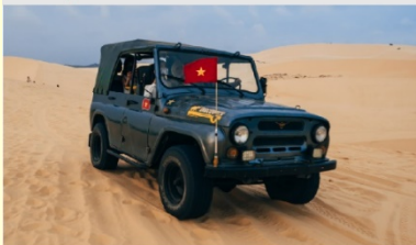
ทะเลทรายขาว