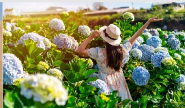
สวนดอกไฮเดรนเยีย