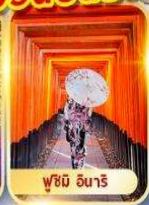
ฟูจิ อินาริ