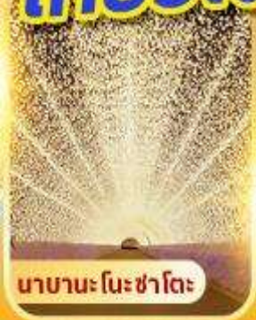
นากานะโนะซาโตะ